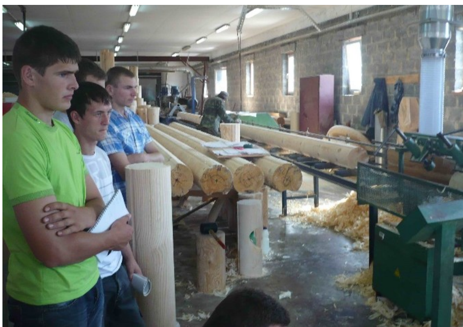
Студенты Технологического факультета на производстве

Благодаря такому подходу к организации практики у нас на факультете практически стопроцентное трудоустройство. Обычно студенты уже на старших курсах начинают где-то работать».