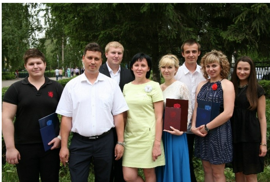
Руководители факультета вместе с выпускниками магистратуры