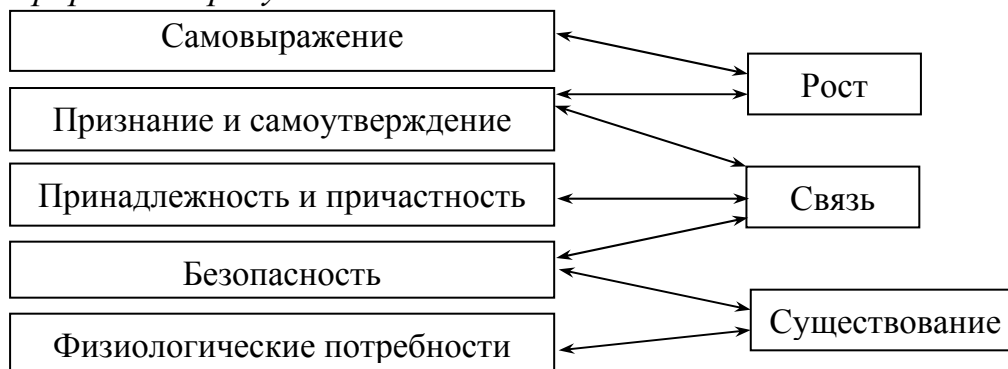
Рис. 1.6. Соотношение иерархии потребностей теории Маслоу и теории Альдерфера

Ссылки на иллюстрации дают по типу «... в соответствии с рисунком 2» – при сквозной нумерации и «... как показано на рисунке 1.6» – при нумерации в пределах раздела. Ссылка на графический материал должна предварять сам рисунок.