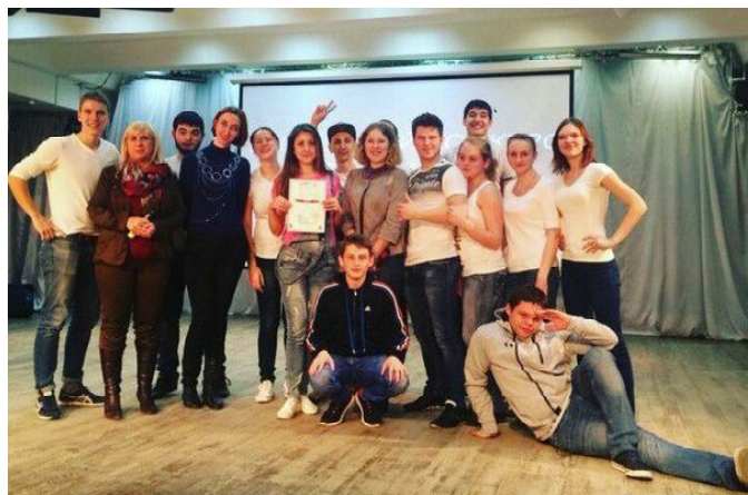
Группа ТБ-21 – победитель конкурса «Группа № 1 – 2016».

Завершающий «творческий» этап был направлен на