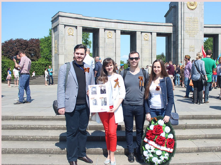
Берлин. 9 мая. Делегация ПГУАС у мемориала Тургартен.

Пензенский государственный университет архитектуры и строительства совместно с Национальным Советом молодёжных и детских объединений России при поддержке Федерального агентства по делам молодёжи и Посольства Российской Федерации провели с 7 по 10 мая 2016 года в г. Берлине Международный молодёжный слёт «Внуки Победы», посвящённый 71-й годовщине Победы в Великой Отечественной войне.