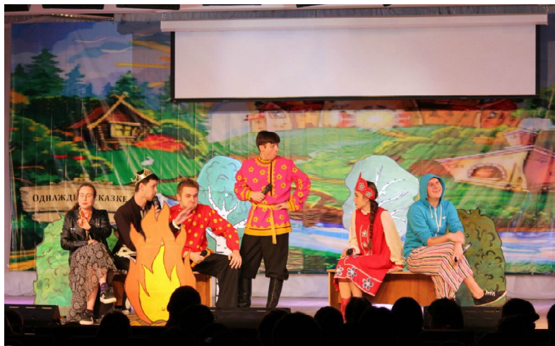
На сцене студенты ИЭИМ, победители студвесны ПГУАС.

По ее итогам были отобраны коллективы и исполнители для участия во Всероссийской студвесне, которая прошла с 15 по 20 мая в Казани. От нашего вуза в ней