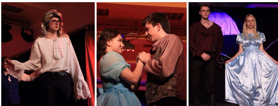
Сцены из спектакля «Обыкновенное чудо».