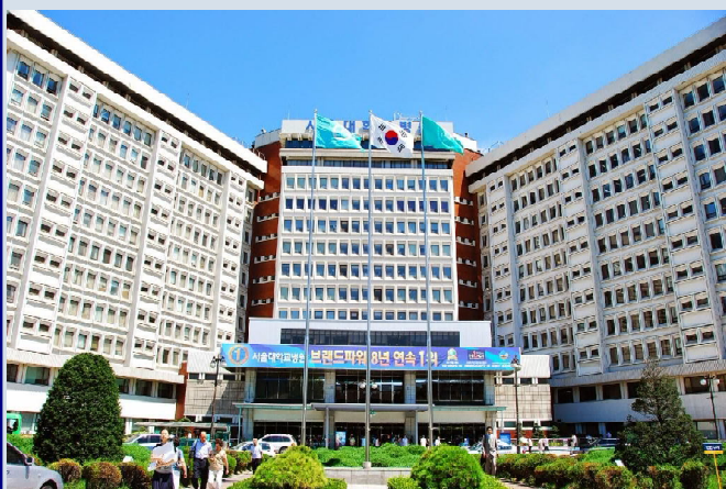
Seoul National University.