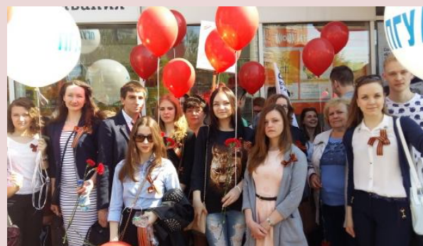
Пенза. 9 мая. Студенты и преподаватели ПГУАС - участники мероприятия у Монумента воинской и трудовой славы пензенцев.

Пензенский государственный университет архитектуры и строительства совместно с Национальным Советом молодёжных и детских объединений России при поддержке Федерального агентства по делам молодёжи и Посольства Российской Федерации провели с 7 по 10 мая 2016 года в г. Берлине Международный молодёжный слёт «Внуки Победы», посвящённый 71-й годовщине Победы в Великой Отечественной войне.