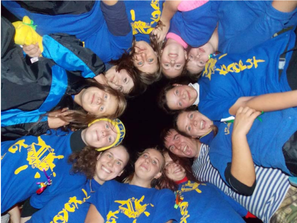
Агитпоход 2013 год