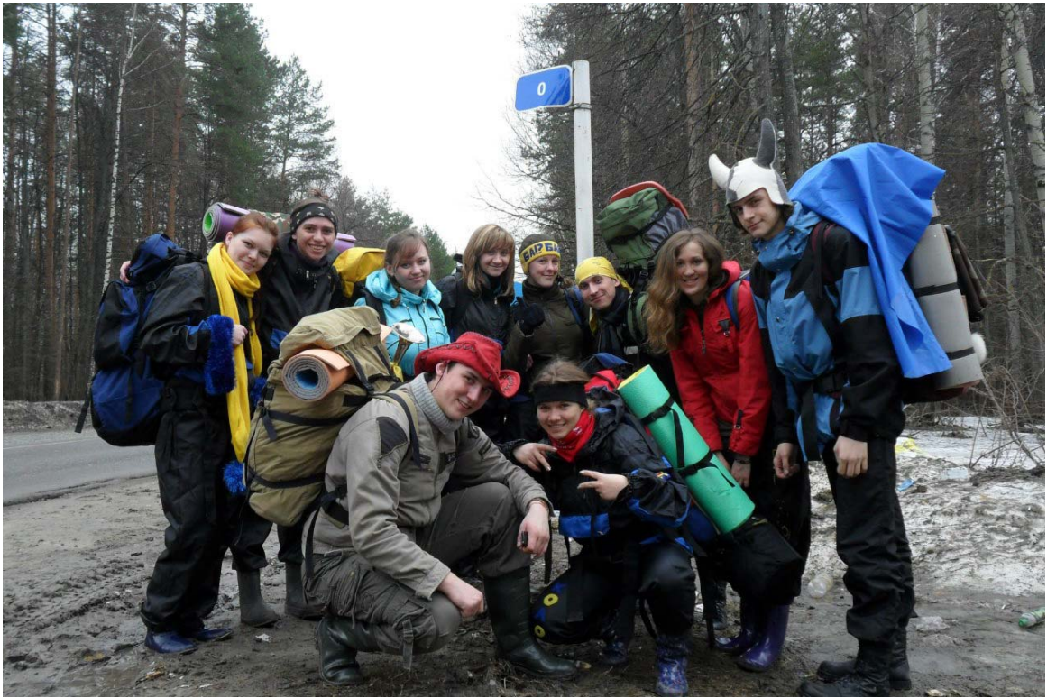
Конкурс командиров 2009 год