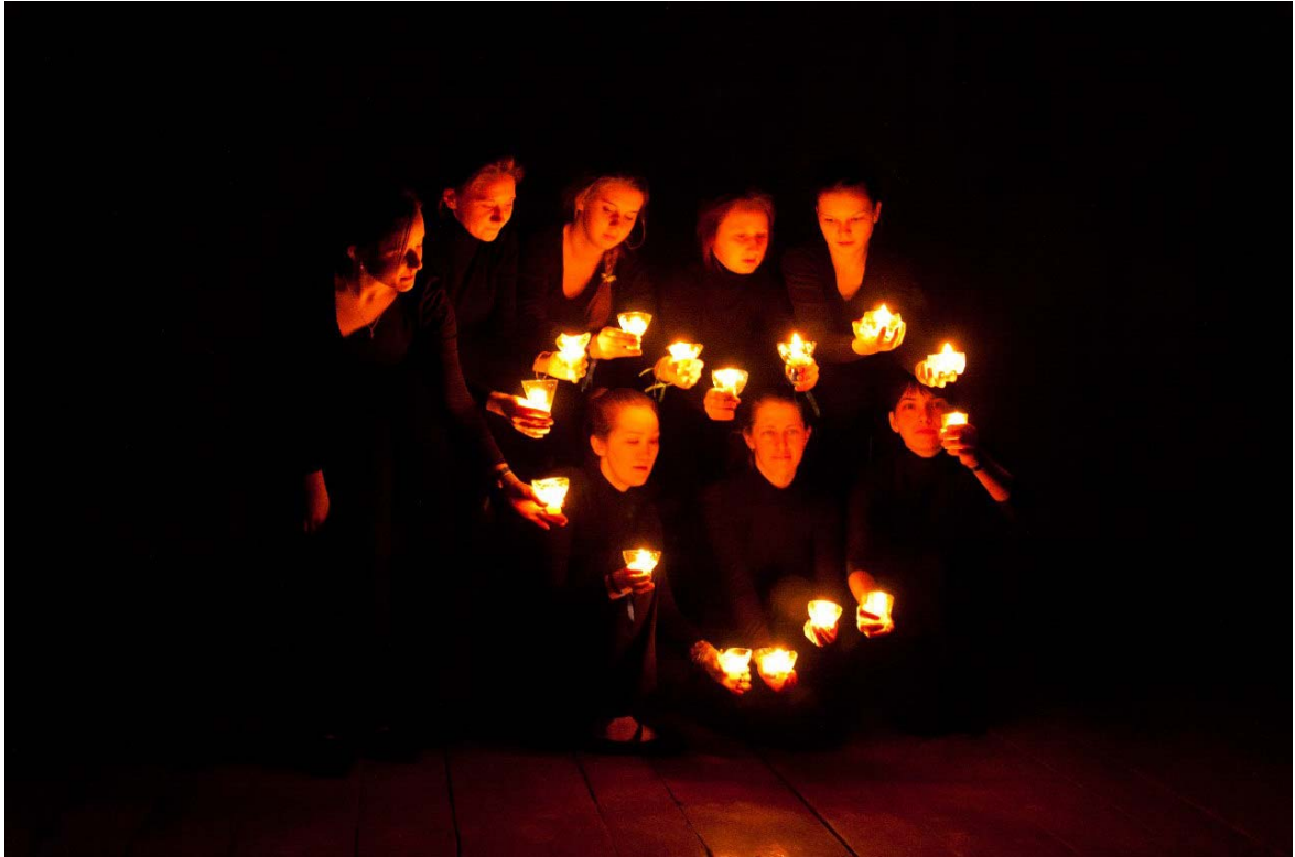
Лето 2013 год