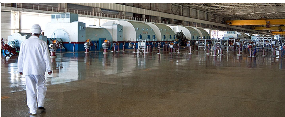
В одном из цехов АЭС.

Попасть на станцию не просто. На проходной установлены специальные кабинки-металлоискатели и за входящими постоянно ведется наблюдение. Для входа в административное здание необходимо приложить магнитный пропуск к специальному считывающему устройству, используется также спе- (Окончание на след. стр.)