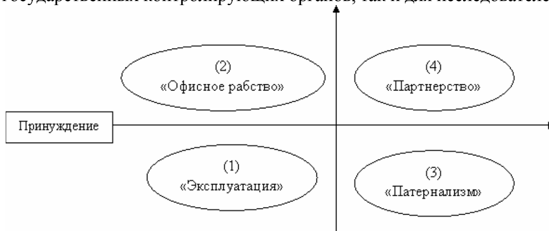
Рис. 2. Типы властных отношений в организации

на удержание работников, исповедуя принцип «не нравится – уходи». Власть-принуждение с наибольшей вероятностью будет применена к не-лояльным участникам взаимодействия, она предполагает низкий уровень организационной приверженности. В связи с тем, что в таких организациях нередки произвол работодателя, открытые нарушения трудовых прав работников, эти организации, представляя наиболее «проблемные» в социальном плане сегменты рынка труда, являются и наиболее закрытыми – как для государственных контролирующих органов, так и для исследователей.